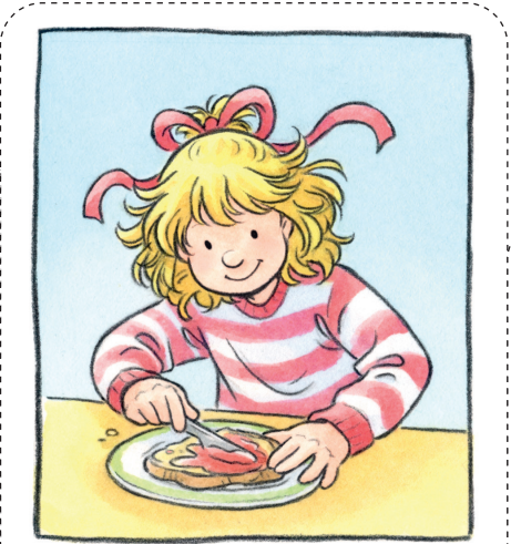
Ich kann alleine ein Brot schmieren