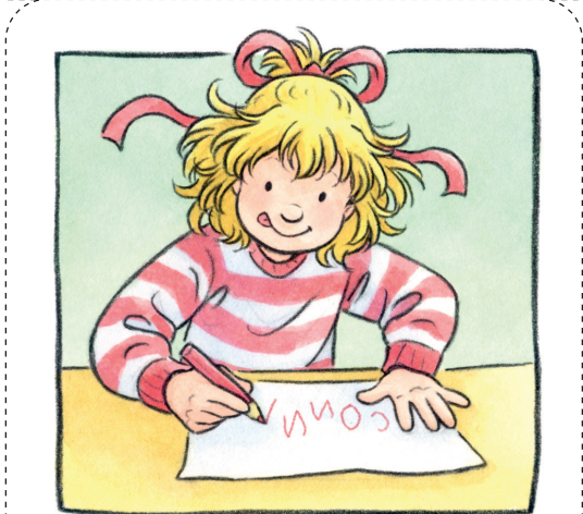
Ich kann meinen Namen schreiben