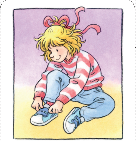
Ich kann alleine meine Schuhe anziehen