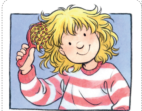
Ich kann mir alleine die Haare bürsten