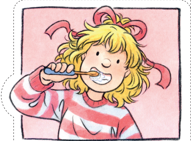
Ich kann alleine Zähne putzen